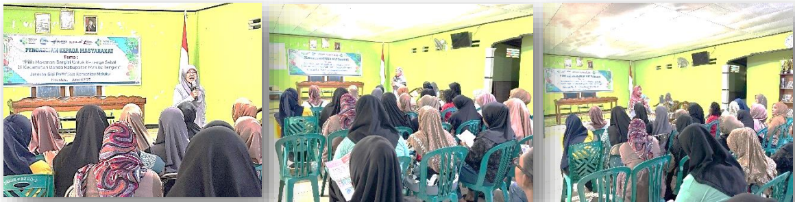
Gambar 1. Kegiatan Edukasi Gizi